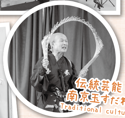
伝統芸能 南京玉すだれ Traditional culture