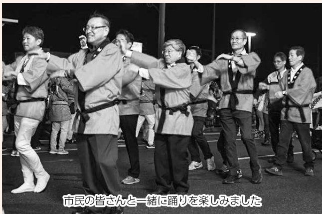
市民の皆さんと一緒に踊りを楽しみました