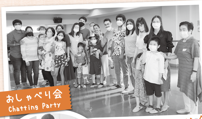
おしゃべり会 Chattering Party